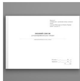
Іменний список для проведення вечірньої повірки, додаток 4 (додаток 60)