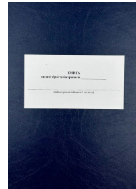
Книга видачі зброї та боєприпасів, додаток 5