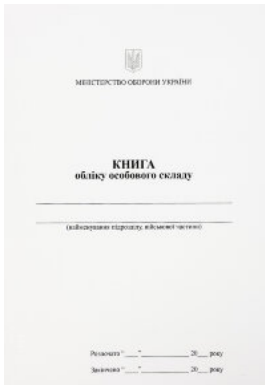
Книга обліку особового складу, додаток 3 (59)