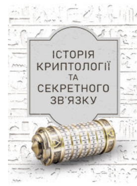
Історія криптології та секретного зв'язку