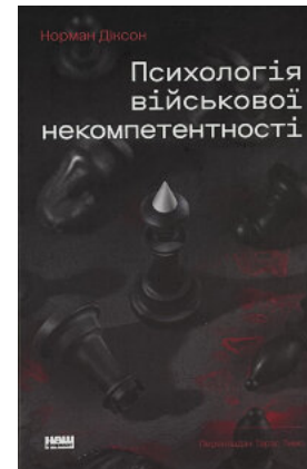
Психологія військової некомпетентності