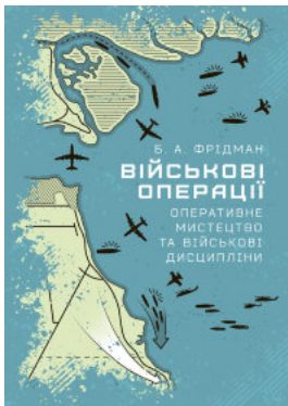
Військові операції: оперативне мистецтво та військові дисципліни