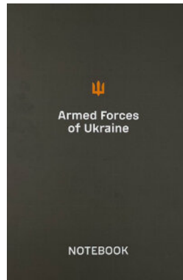
Блокнот для військових ЗСУ