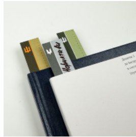
Закладки для військових журналів