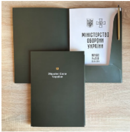
Папка для документів (військовим ЗСУ)