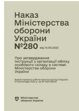
Наказ МОУ № 280 — Інструкція з організації обліку особового складу в системі МОУ