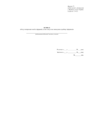
Журнал обліку електронних носіїв інформації, на які планується записувати службову інформацію. Додаток 75