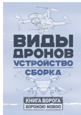
Виды дронов. Устройство. Сборка