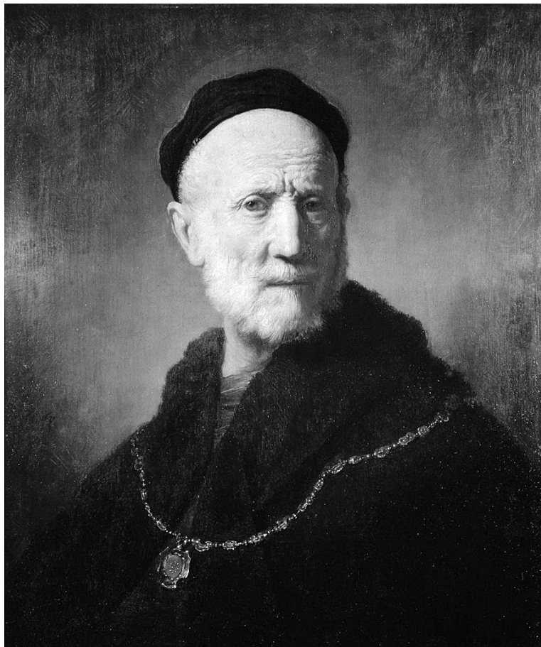
Рембрандт. Отец (1631).