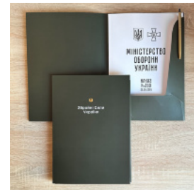
Папка для документів (військовим)