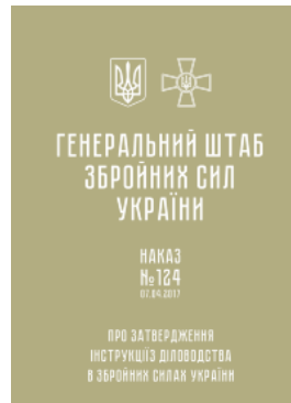
Наказ ГШ ЗСУ № 124 — Інструкція з діловодства у Збройних Силах України (2017 рік)