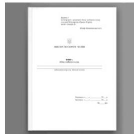
Журнал обліку хворих направлених на стаціонарне лікування, військово-лікарську комісію, та осіб, що потребують систематичного лікарського...