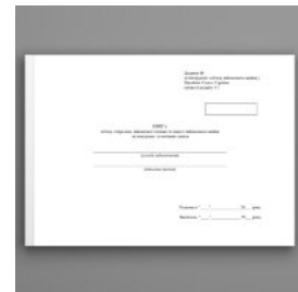
Книга обліку наявності та руху військового майна (служба забезпечення), додаток 46 (додаток 47)