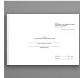
Журнал результатів звірки обліку військового майна, додаток 9 (Додаток 8)