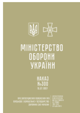
Наказ МОУ № 300 — Положення про військове (корабельне) господарство ЗСУ