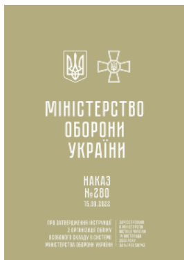
Наказ МОУ № 280 — Інструкція з організації обліку особового складу в системі МОУ