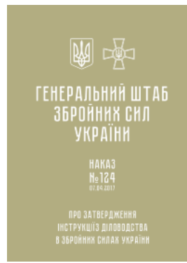
Наказ ГШ ЗСУ № 124 — Інструкція з діловодства у Збройних Силах України (2017 рік)