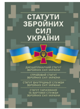
Статути збройних сил України