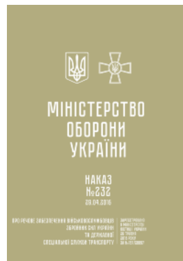
Наказ МОУ № 232 — Про речове забезпечення військовослужбовців ЗСУ та ДССТ