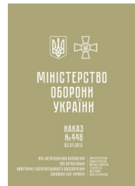
Наказ МОУ № 448 — Положення про організацію квартирно-експлуатаці йного забезпечення ЗСУ