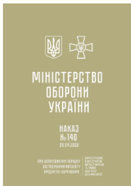
Наказ МОУ № 140 — Порядок застосування Каталогу продуктів харчування