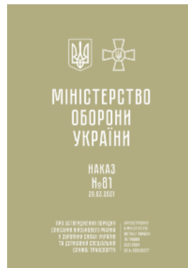
Наказ МОУ № 81 — Порядок списання військового майна у ЗСУ та ДССТ