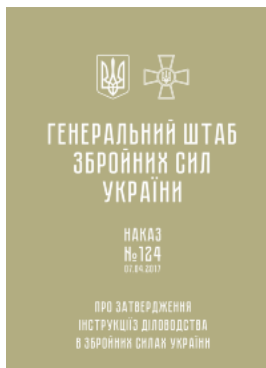
Наказ ГШ ЗСУ № 124 — Інструкція з діловодства у Збройних Силах України (2017 рік)