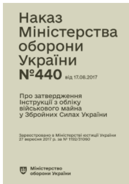
Наказ МОУ № 440 — Інструкція з обліку військового майна у ЗСУ