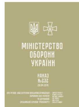
Наказ МОУ № 232 — Про речове забезпечення військовослужбовців ЗСУ та ДССТ