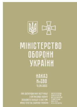
Наказ МОУ № 280 — Інструкція з організації обліку особового складу в системі МОУ