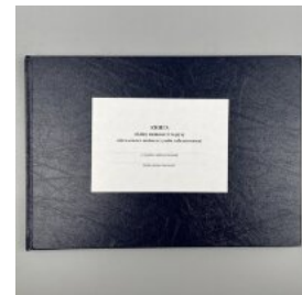
Книга обліку наявності та руху військового майна (служба забезпечення), додаток 46 (додаток 47)

Перейти до категорії Книги обліку для військових