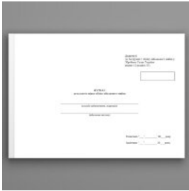
Журнал результатів звірки обліку військового майна, додаток 9 (Додаток 8)