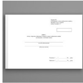
Книга обліку озброєння військової техніки та іншого військового майна за номерами і технічним станом, додаток 48 (додаток 49)