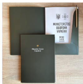
Папка для документів (військовим ЗСУ)