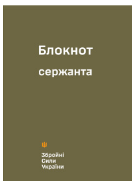
Блокнот сержанта (ЗСУ)