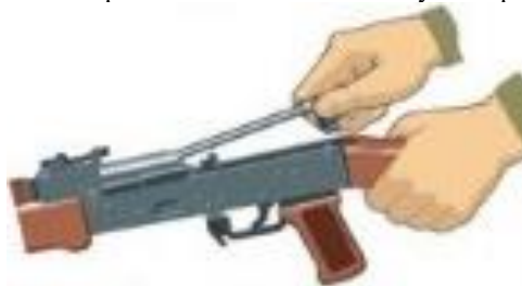
Рисунок 8 – від'єднання поворотального механізму.

6. Від'єднати поворотальний механізм. Утримуючи автомат (кулемет) лівою рукою за шийку приклада, правою подати вперед направляючий стержень поворотального механізму до виходу його п'ятки із повздовжнього пазу ствольної коробки; припідняти задній кінець направляючого стержня (рисунок 8) і вийняти поворотальний механізм з каналу затворної рами.