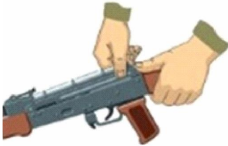
Рисунок 7 – від'єднання кришки ствольної коробки.

5. Від'єднати кришку ствольної коробки. Лівою рукою обхопити шийку приклада, великим пальцем цієї руки натиснути на виступ направляючого стержня поворотального механізму, правою рукою припідняти вгору задню частину кришки ствольної коробки (рисунок 7) та від'єднати кришку.