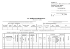
АКТ приймання-передачі військового майна, додаток 22