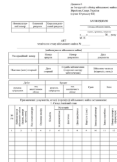
АКТ технічного стану військового майна, додаток 6