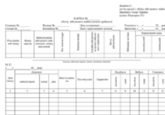
КАРТКА обліку військового майна (некатегорійного), додаток 21