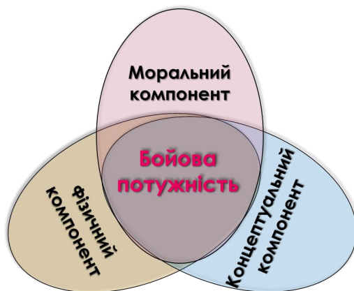
Рис. 1.1. Компоненти бойової потужності військ (сил)

і штабами НАТО. Доктрина містить корисну інформацію для країн – членів НАТО, партнерів і країн, що не є його членами.