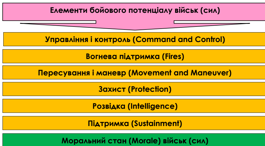
Рис. 1.2. Елементи бойового потенціалу військ (сил) згідно з практикою провідних країн – членів НАТО

Так, в арміях провідних країн – членів НАТО врахування морального стану особового складу обов'язкове під час визначення співвідношення потенційних бойових можливостей військ (сил) (рис. 1.2).